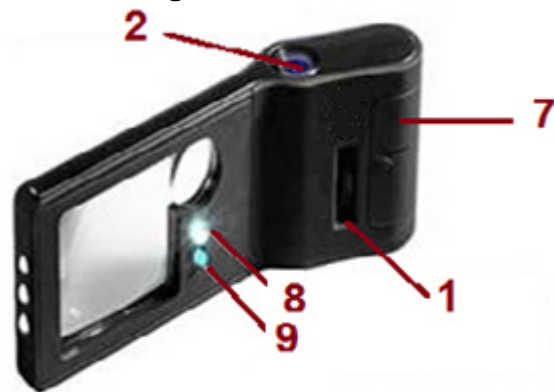
Fig 2 – Achter aanzicht